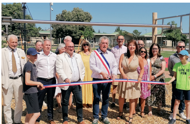
Inauguration le 24 juin du Parc de la Mirandole, première réalisation du budget participatif.