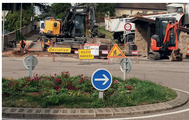
Rénovation du rond-point du Lavoir. La municipalité a réalisé quatre plateaux afin d'améliorer la sécurité de ce carrefour très fréquenté.